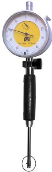
Рисунок А.2 - Нутромір індикаторний з відліковим пристроєм механічного типу без центруючого містка НИ-6-10