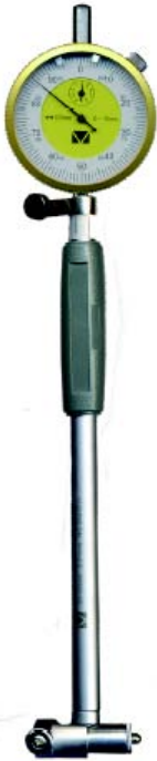
Рисунок А.1 - Нутромір індикаторний з відліковим пристроєм механічного типу з центруючим містком